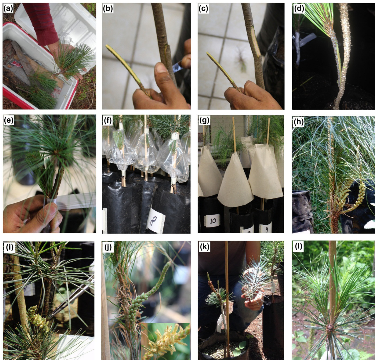
Figure 1. Sequence of grafting stages. a) Pinus rzedowskii scion, b) cutting the rootstock stem, c) size matching, d) side-veneer grafting, e) tying the graft with plastic tape (MD brand), f) plastic bag with water to avoid dehydration, g) brown paper cover to reduce light incidence, h) grafting with rootstock plants of P. ayacahuite var. veitchii , with developing male strobiles, i) second pruning of P. pinceana at the central-top part of the graft with the terminal end unpruned and male strobiles, j) graft of P. rzedowskii with larger male strobiles at the pollen release stage, k) third pruning and graft release, and l) grafting with new needles and twigs of P. rzedowskii .

Figura 1. Secuencia de las etapas de injertado. a) vareta de Pinus rzedowskii , b) corte en el tallo de la planta-patrón, c) acoplamiento de tamaños, d) injertado de enchapado lateral, e) amarrado con cinta plástica para injerto (marca MD), f) bolsa plástica con agua para evitar deshidratación, g) cubierta de papel estraza para disminuir la incidencia de luz, h) injerto con plantas-patrón de P. ayacahuite var. veitchii , con estróbilos masculinos en desarrollo, i) segunda poda de P. pinceana en la parte central-superior del injerto con el extremo terminal sin podar y estróbilos masculinos, j) injerto de P. rzedowskii con estróbilos masculinos de mayor tamaño en la etapa de liberación del polen, k) tercera poda y liberación del injerto, e l) injerto con acículas y ramillas nuevas de P. rzedowskii .