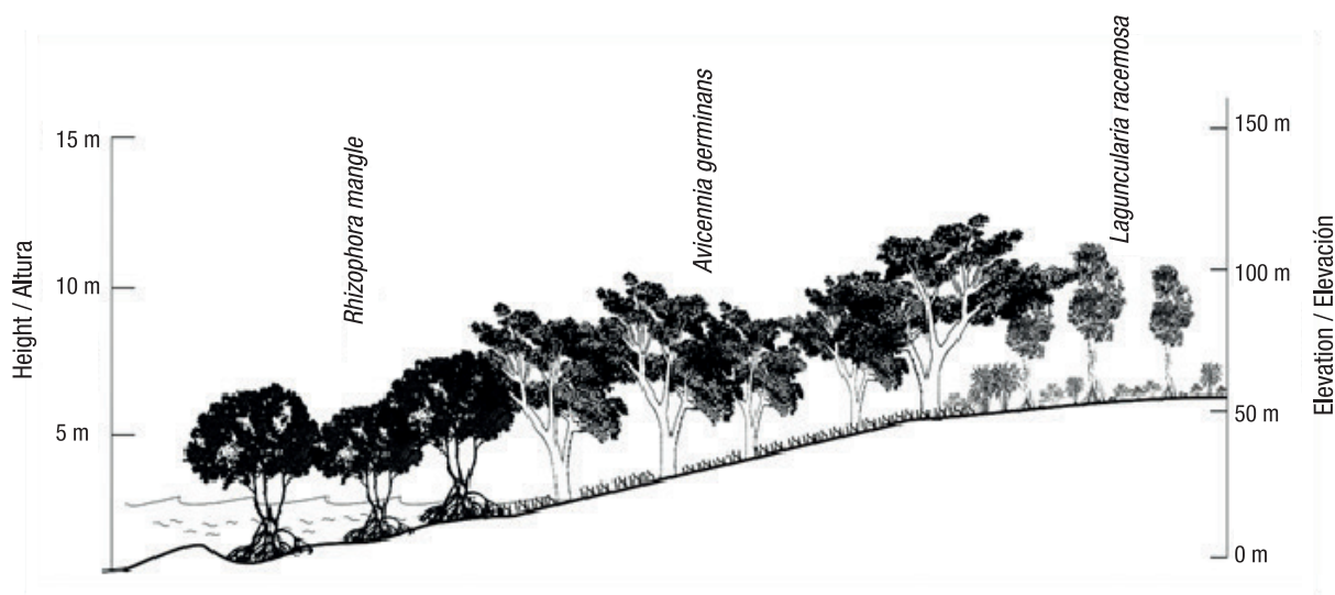
Figure 2. General physiognomic profile of the mangrove of the Mandinga Lagoon in Veracruz. Figura 2. Perfil fisonómico general del manglar de la Laguna de Mandinga en Veracruz.

La densidad del manglar de Mandinga fue de 721 árboles·ha -1 ; A. germinans fue la especie más abundante