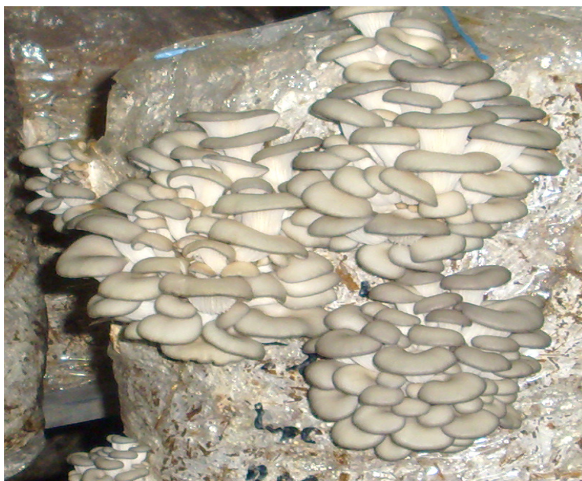
FIGURA 1. Pleurotus sp. utilizado para el aislamiento e identificación de esteroides. FIGURE 1. Pleurotus sp. used for isolation and identification of sterols.

febrero de 2012. Las setas fueron cultivadas en rastrojo de maíz y cebada. La vida de anaquel fue de dos días a una temperatura entre 3 a 7 °C. Una muestra liofilizada se mantiene en resguardo en la colección de hongos macroscópicos de LATEX.