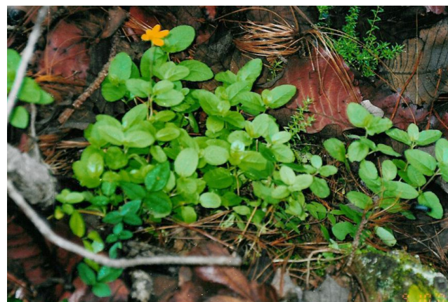
FIGURA 1. Heliopsis longipes S. F. Blake (Asteraceae), hierba endémica de la región de la Sierra Álvarez y la Sierra Gorda, en el centro de México.