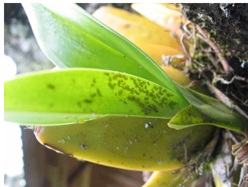
FIGURA 3. Incidencia de T. aurantii sobre S. martiniana