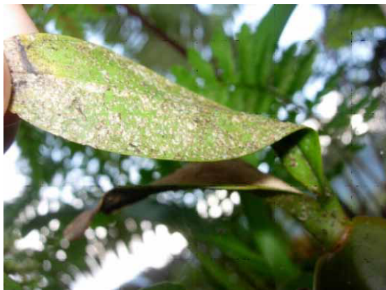
FIGURA 4. Incidencia de Diaspis sp. sobre una especie de orquídea no identificada