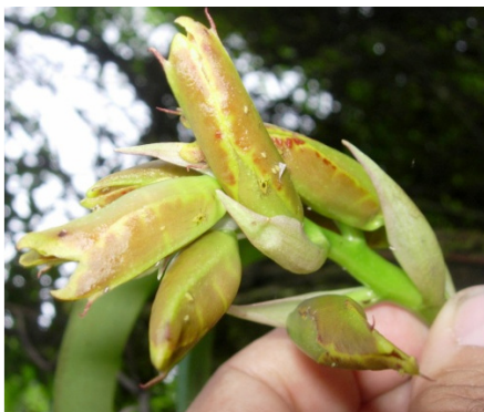
FIGURA 2. Incidencia de A. spiraecola (Patch.) y M. lulem sobre flores de R. splendens