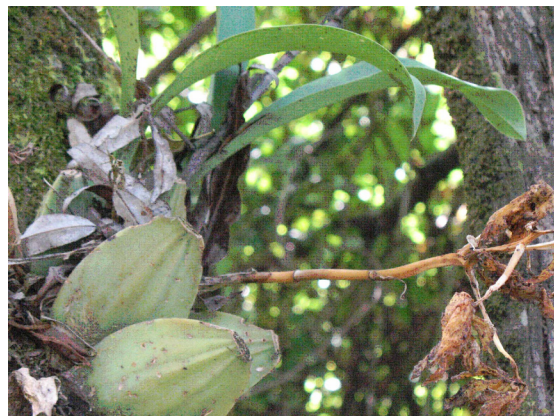
FIGURA 5. Incidencia de M. lulem sobre C. pendula .