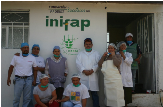
FOTO 1. Taller de producción de queso establecido en la Comunidad de Casa de Cerros, Pánuco, Zacatecas.

Tecnología 6. Producción de queso de leche de cabra en microempresa familiar. Se estableció un taller de quesos (Foto 1), con una infraestructura mínima, con capacidad de 200 l/día. Se impartieron dos cursos de diferente tipo de queso a 14 mujeres por productores de la región Laguna en México. Se realizó una evaluación organoléptica entre quesos producidos con leche de caprino y de bovino comparando los resultados mediante una prueba de Chi-cuadrada (SAS, 1992).