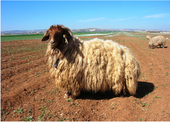
FIGURA 1. Carnero adulto Awassi cubierto de lana FIGURE 1. Mature Awassi ram with full fleece.