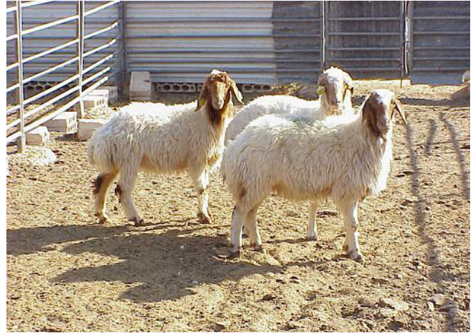
FIGURA 2. Oveja Awassi de un año FIGURE 2. Yearling Awassi ewes

las características de producción y reproducción de la raza Awassi.