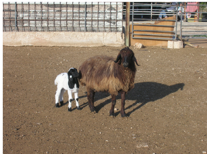
FIGURA 3. Oveja Awassi de cara negra y cordero FIGURE 3. Black-faced Awassi ewe and lamb.

The Middle East region has mostly arid and semi arid terrains requiring highly adapted animals under such low input conditions. The Awassi breed is quite desirable due to its milking ability, adaptability to harsh environmental conditions, ability to walk for long distances for grazing (10 to 15 km per day), tolerance to high temperatures, disease resistance, strong flocking instincts, capability of adapting to adverse management conditions and the popularity of its meat (Epstein, 1985; Gursoy et al. , 1992;