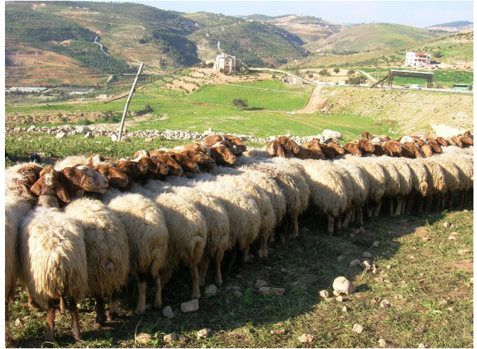
FIGURA 4. Ovejas Awassi reunidas para ser ordeñadas utilizando el método tradicional de restricción.

Sistema extensivo (tradicional o nómada): Este sistema se adapta principalmente a las zonas áridas y semiáridas de Jordania (regiones del este y sur) donde su promedio anual pluvial se encuentra por debajo de los 100 mm. La temperatura promedio durante el día en estas regiones es de 8 °C en el mes de enero y 31 °C en el mes de julio. Este sistema cuenta con los menores insumos comparándolo con los sistemas restantes. El sistema extensivo consiste en mover a las ovejas de un sitio a otro en búsqueda de agua y alimento. Las áreas para pastoreo generalmente no son cultivables y no se utilizan para la producción agrícola. Durante los periodos de baja disponibilidad de alimentos, los